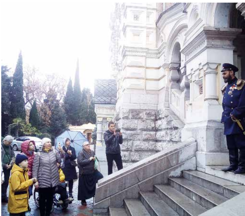
Из собора Александра Невского неожиданно выходит Император Николай II.

Театр экскурсий «МИР ПРЕКРАСЕН» + 7 (978) 727-89-22 teatrekursiy.ru