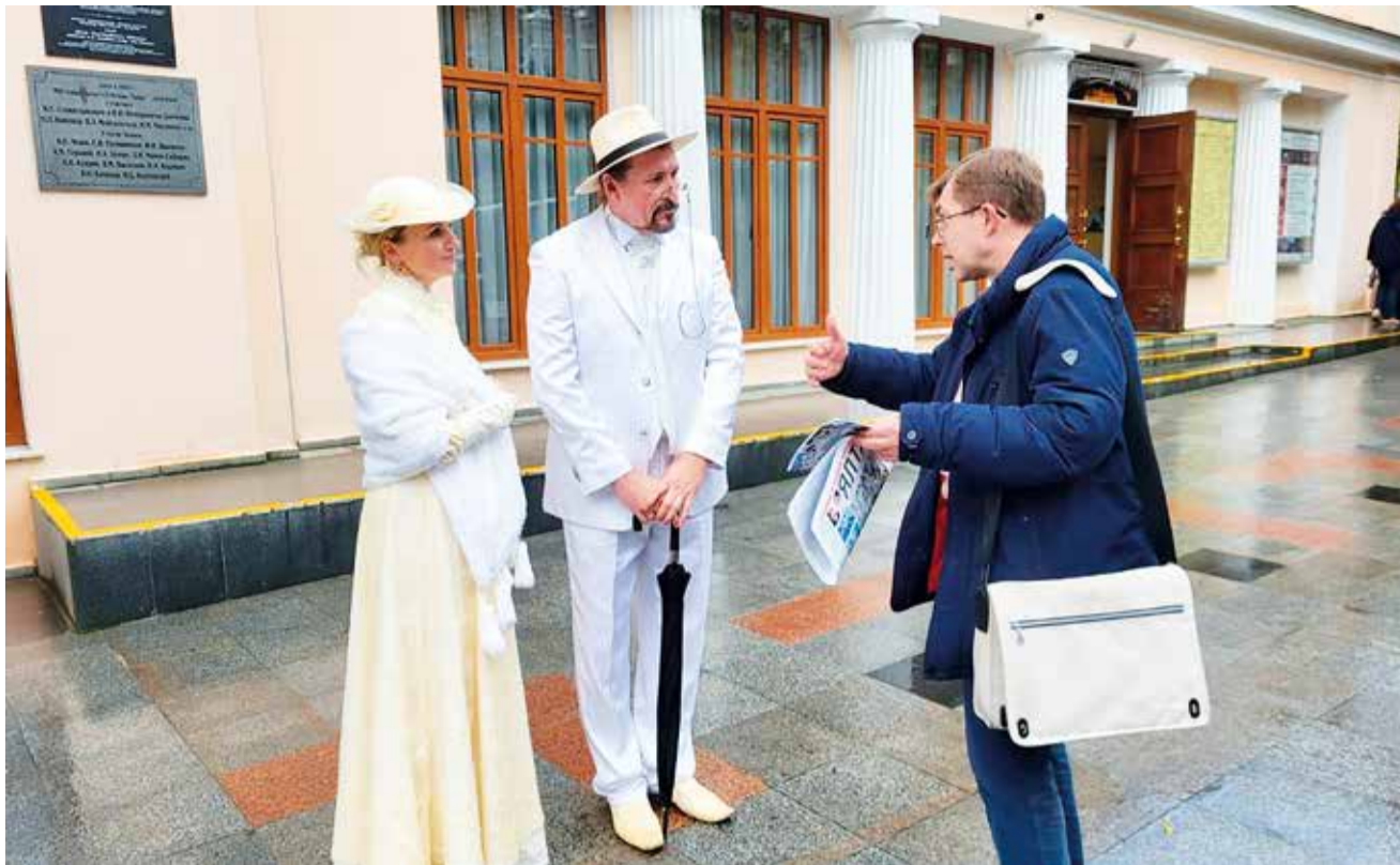
Встреча с А.П. Чеховым и его женой О.Л.Книппер у входа в знаменитый ялтинский театр.