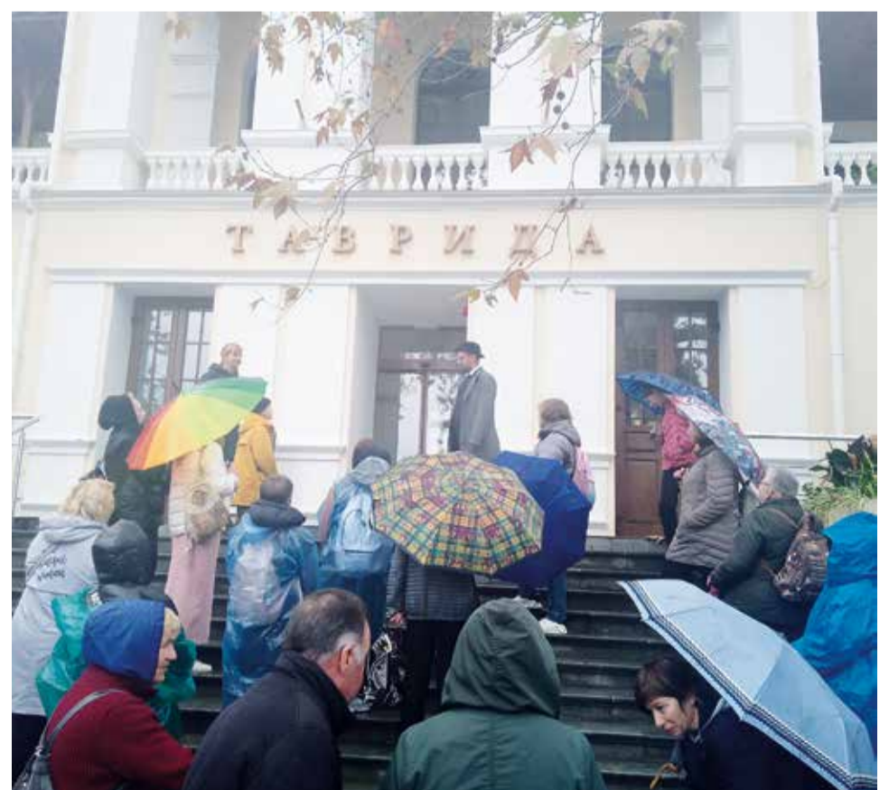
Доктор С. П. Боткин у гостиницы «Таврида» («Россия»), построенной в 1875 г.