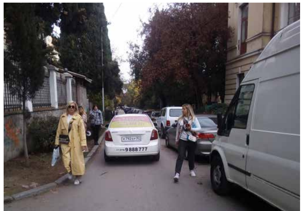
Типичная картина: несутся машины, пешеходы от них уворачиваются, а тротуаров как не было, так и нет... Неужели прокуратура Ялты не видит несоответствие догги техническим регламентам и не торопит власть имущих с наведением порядка?